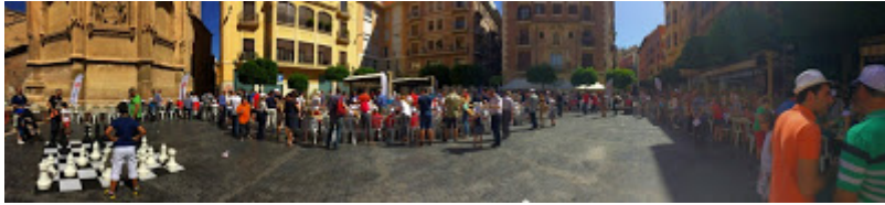
Panorámica de la Plaza de Los Apóstoles antes de empezar.

El I Torneo Ucoerm se disputó a cinco rondas, con cada participante dándolo todo para entrar en los cuatro primeros de cada categoría, o sea, acceder a las simultáneas con la protagonista.