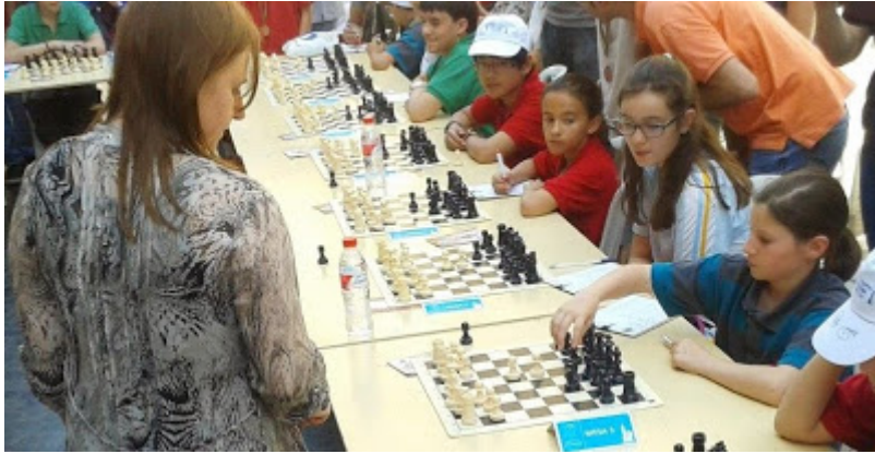
Tres chicas de la cantera regional, dejando el pabellón bien alto.