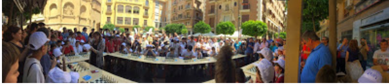
Panorámica del ambiente durante las simultáneas.

El I Torneo Ucoerm se disputó a cinco rondas, con cada participante dándolo todo para entrar en los cuatro primeros de cada categoría, o sea, acceder a las simultáneas con la protagonista.