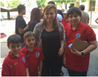
Escudos de Casa Ajedrez arropan a Judit.

Sobre la gran Judit Polgar sobran las presentaciones. La más grande ajedrecista de la historia obtuvo el título de Gran Maestro en 1991 a los 15 años y cuatro meses, convirtiéndose en su tiempo en la persona más joven en obtenerlo, antes que cualquier hombre. Su decidido juego de ataque es una garantía de espectáculo.